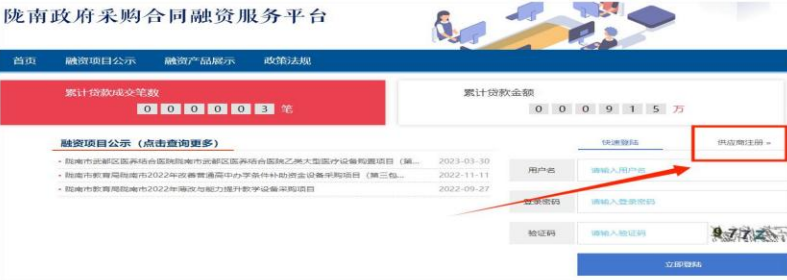
陇南政府采购合同融资服务平台

需要办理合同融资的供应商登录平台，已注册的输入“用户名”“密码”“验证码”登录（注意区分大小写），未注册的供应商点击“合同融资供应商注册”进行注册。