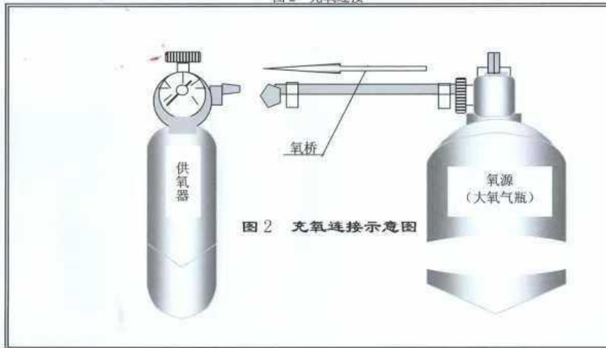
图 2 充氧连接