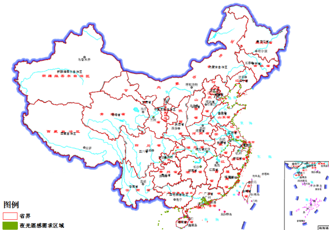
图2 包5夜光遥感需求范围示意图

01包： 对我国西北、北部（图1粉色区域）等获取分散区域，在8-11月为主的获取时相周期内，拟采购110万平方千米亚米分辨率商业卫星数据。以及自主卫星获取漏洞区域，补充面积10万平方千米（范围待定）。共计120万平方千米。