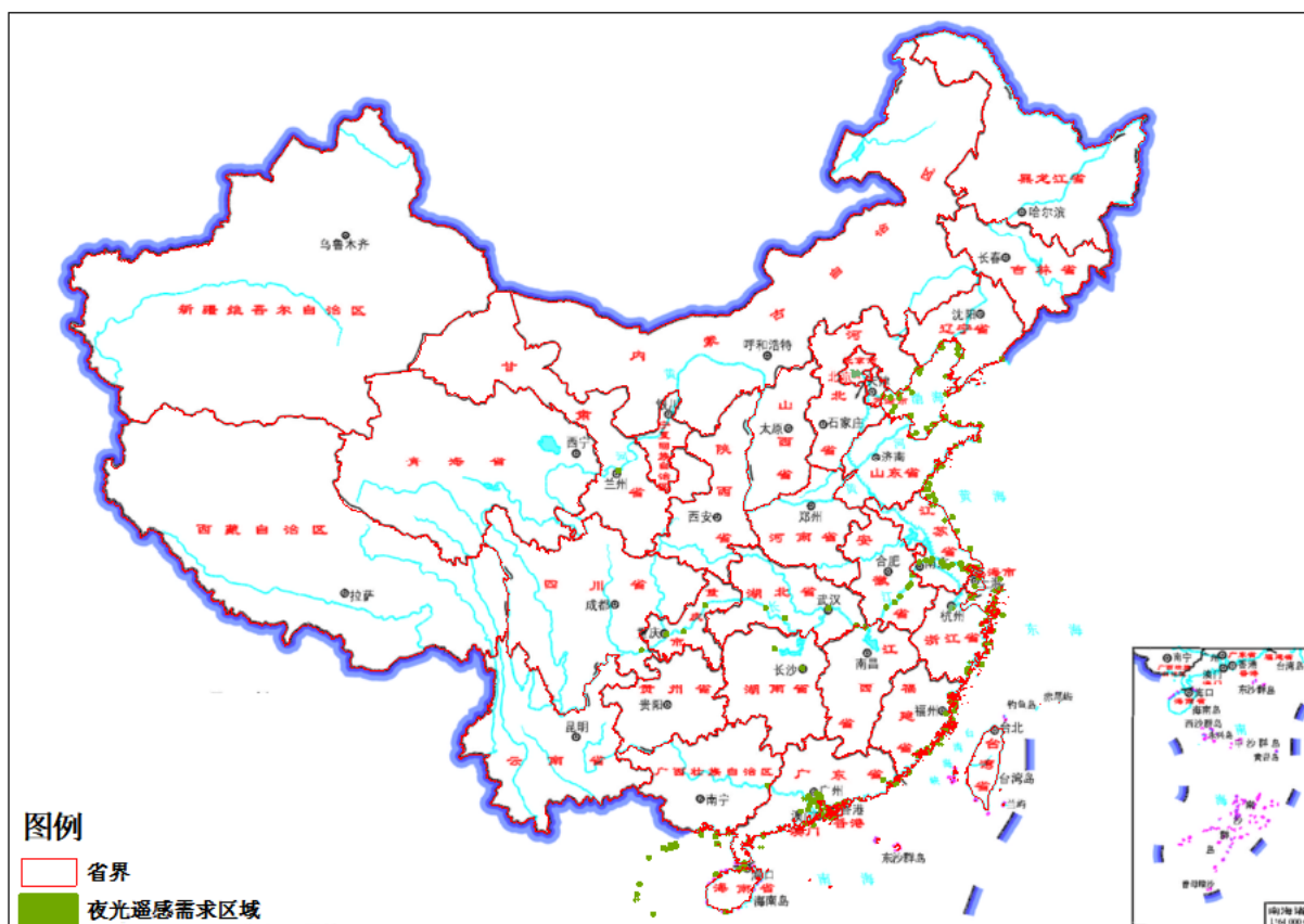
图2 05包夜光遥感需求范围示意图