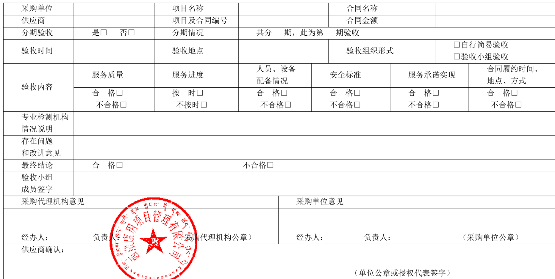
政府采购履约验收书参考样本（服务类）

说明：1. 该表为服务类项目履约验收的参考样表，采购人或采购代理机构可以根据工作实际进行调整。