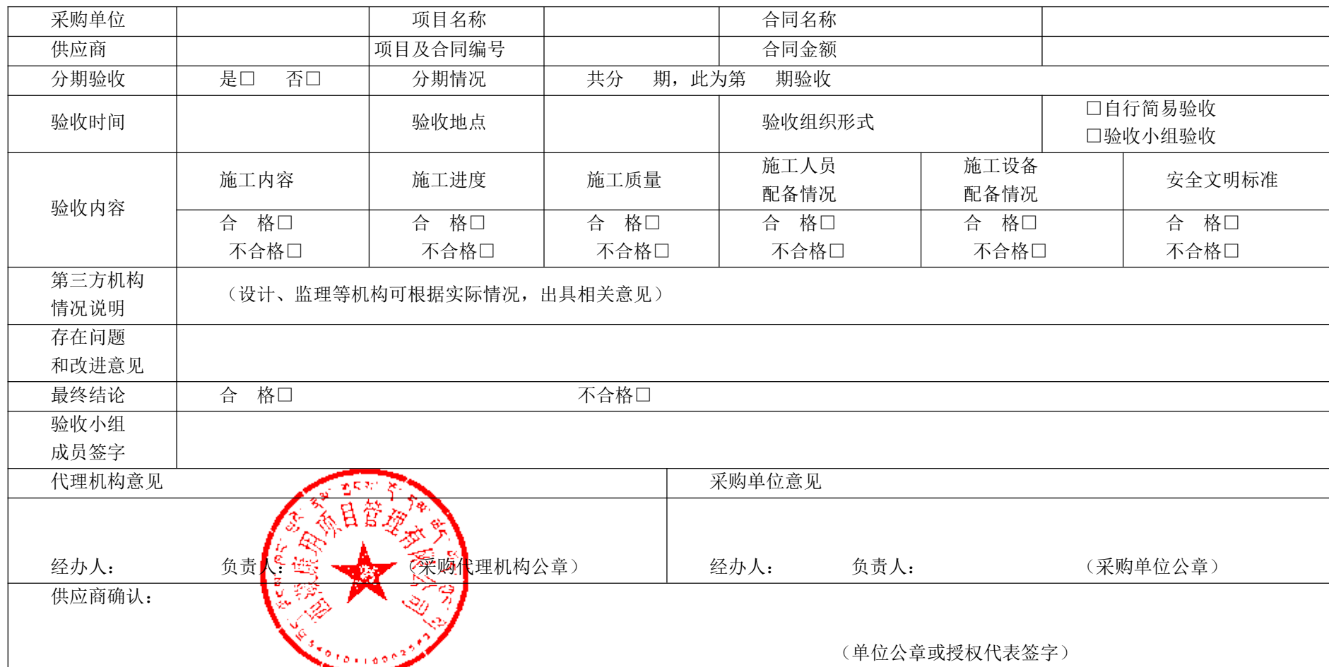
政府采购履约验收书参考样本（工程类）

说明：1. 该表为工程类项目履约验收的参考样表，采购人或采购代理机构可以根据工作实际进行调整。