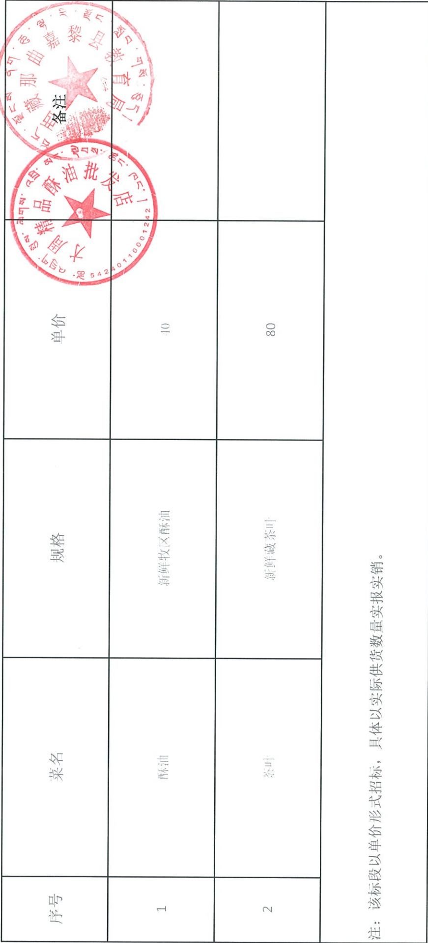
嘉黎县教育系统2024年9月至12月“三包”物资酥油、茶叶采购清单