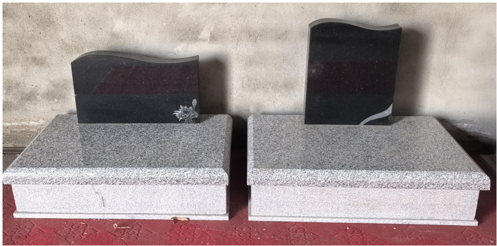
花岗岩公益双人墓技术参数表