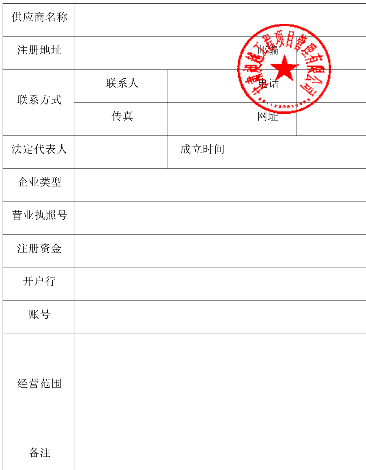
供应商基本情况表