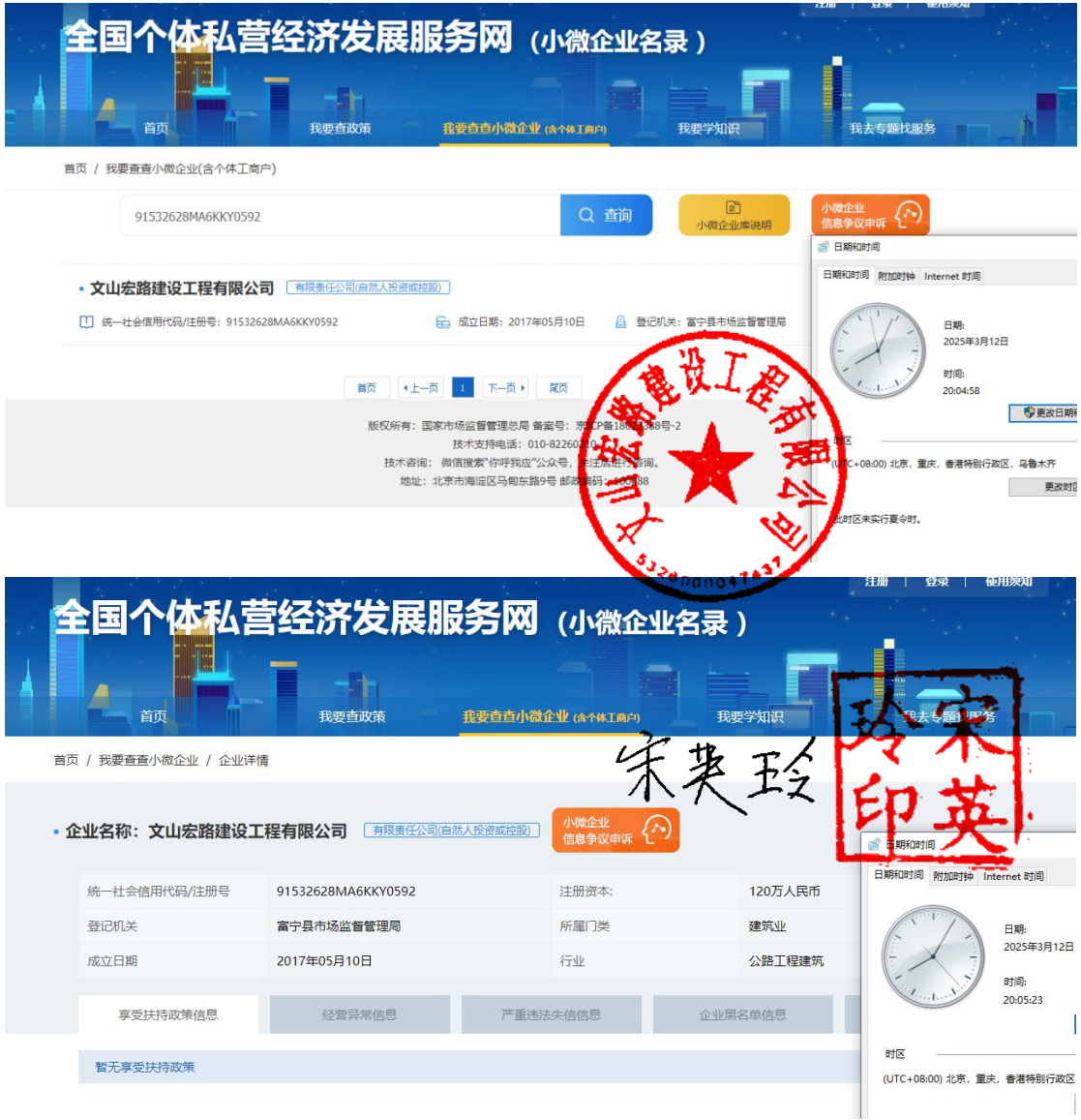
小微企业名录查询截图