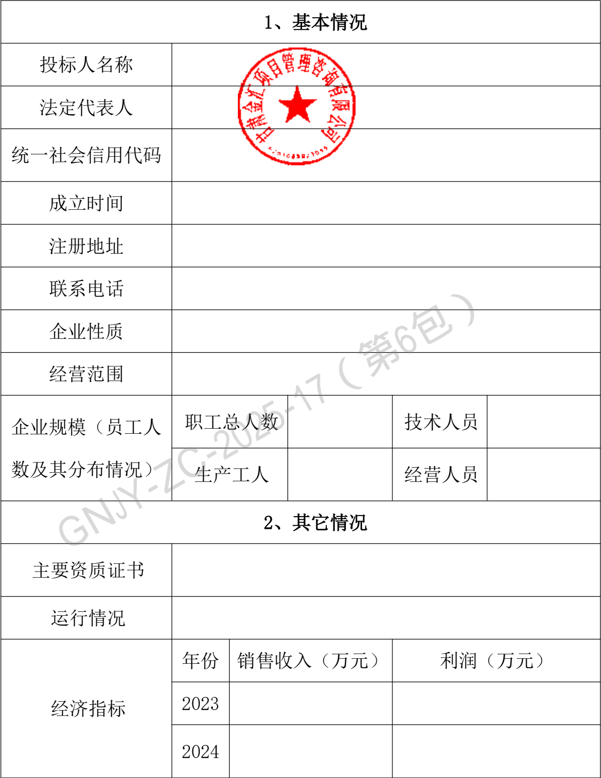
(6) 投标人基本情况表