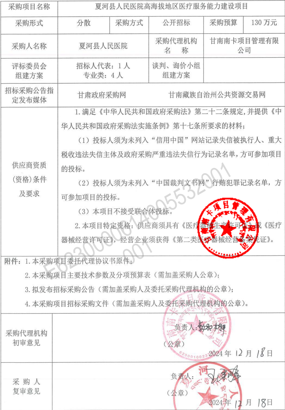
医药采购项目招标采购公告及文件审查表