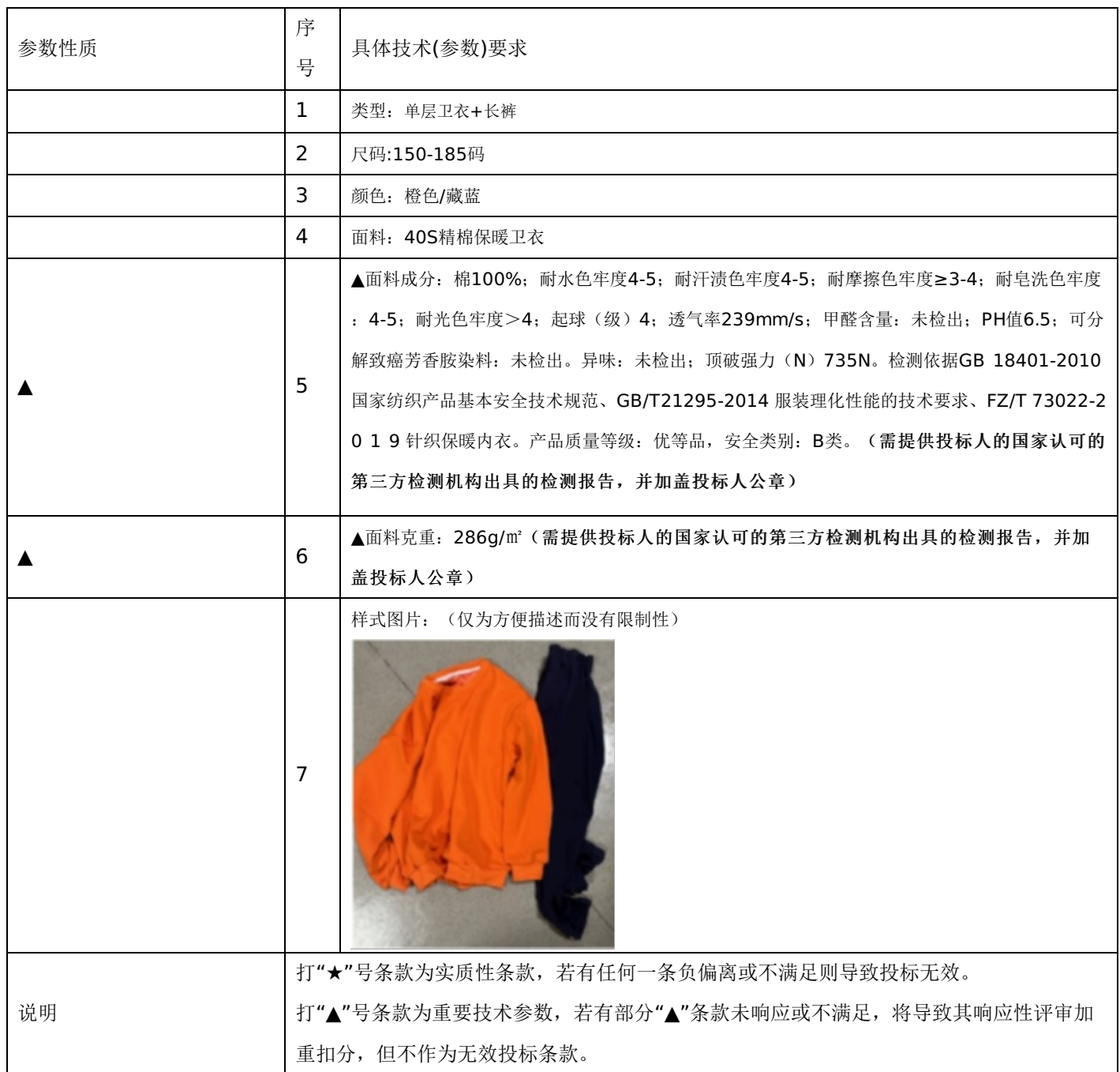
附表五：加绒保暖卫衣套装