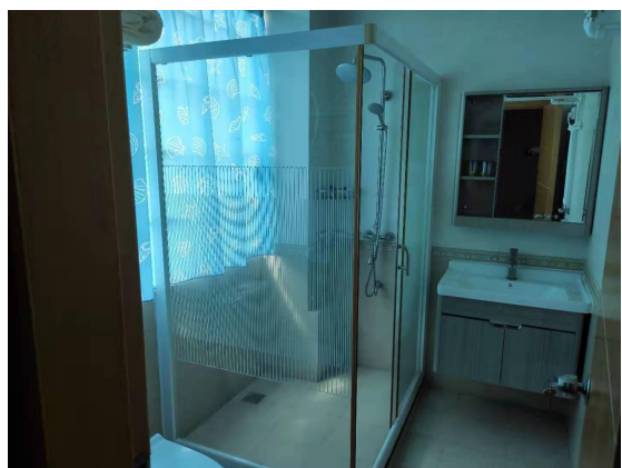
综合楼三、四楼卫生间现状图