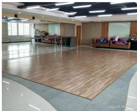
综合楼五楼妇女活动室现状图