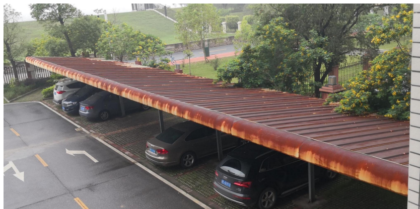
恒福办公点车棚现状图