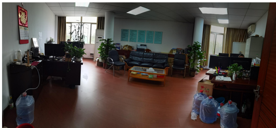
局办公楼406室现状图