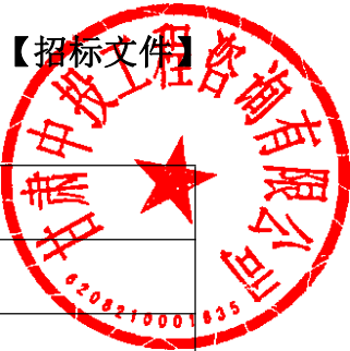
自然人基本情况表