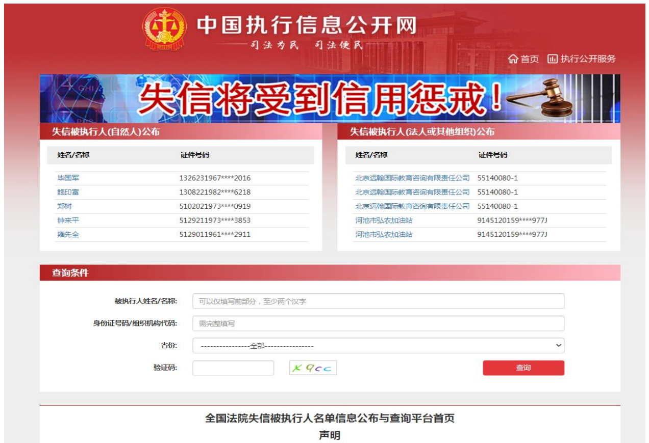
信用记录查询截图