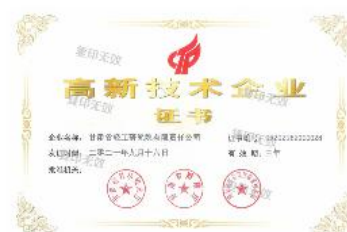
高新技术企业证书