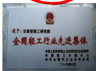
全国轻工行业先进集体