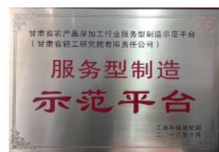
服务型制造示范平台