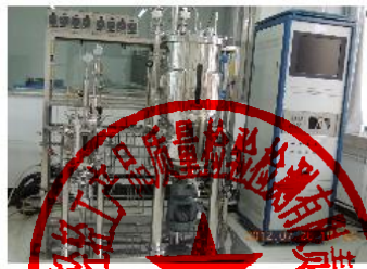
全自动生化反应器