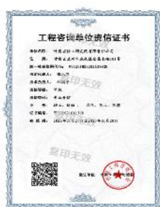
工程咨询甲级资信证书

近年来公司科技成果获得国家级、省部级科技进步奖 3 次；获省优秀工程咨询成果奖 15 次；获得发明专利授权 4 项，帮助企业申请并获得发明专利授权 3 项；获国家科技部“技术市场金桥奖”；农副 products 深加工创新团队获“甘肃省五一劳动奖状”和“全国工人先锋号”荣誉称号；2016 年我院获得“中国轻工行业科技创新先进集体”称号，2018 年获“全国轻工行业先进集体”称号。