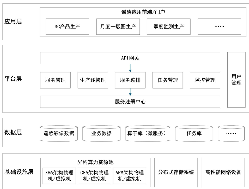
图 1 总体架构图