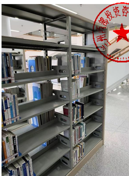
1. 定制六层双面钢木书架