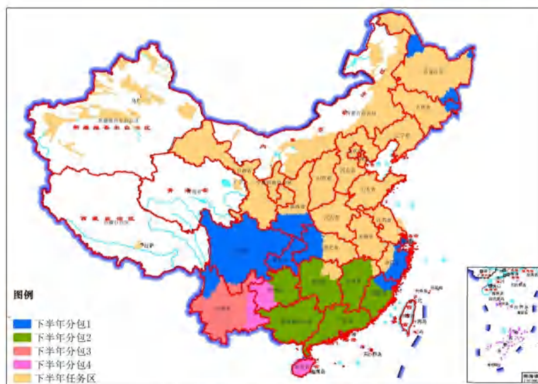
图2 下半年采购分包示意图 (9-12月)

亚米商业卫星影像采购分包1： 对我国东北部、东南部、南部（图1及图2蓝区域）等光学影像获取较为困难的区域，在6-7月为主的获取时相周期内，拟采购64万平方千米亚米分辨率商业卫星补充数据；在9-12月为主的获取时相周期内，拟采购136万平方千米亚米数据。