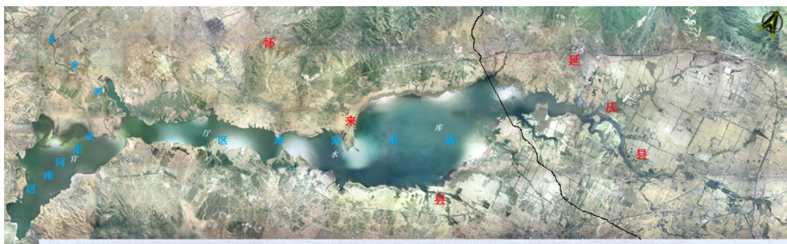
图 1-2 官厅水库库区影像图