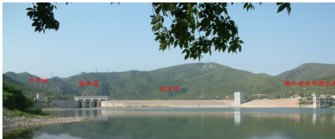
图 1-3 官厅水库枢纽工程

官厅水库为大(1)型综合利用水利枢纽, 工程等级为 I 等工程, 主要建筑由输水泄洪洞、拦河坝、溢洪道、水电站四部分组成, 均为 1 级建筑物。