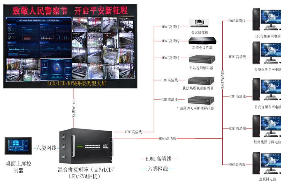
广州铁路公安局智慧派出所可视化视频融合系统架构