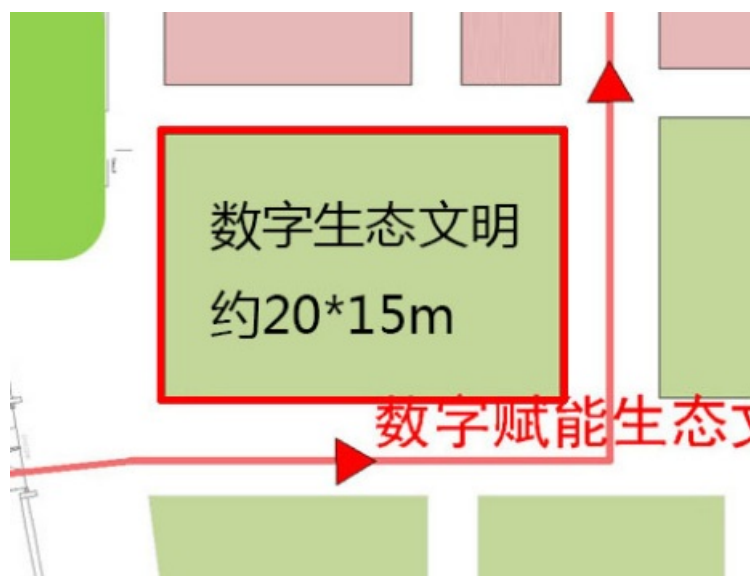
参考位置、面积、参观路线（仅供投标方案参考）