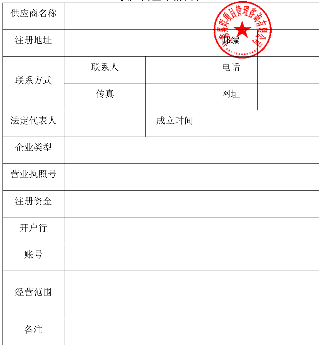
供应商基本情况表